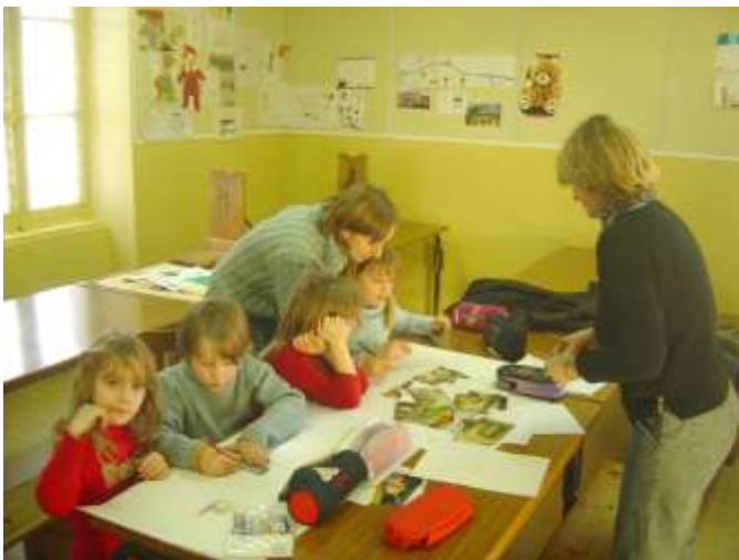
Intervention école de Beaupont – 2005

Pour tout renseignement complémentaire, contactez Patrimoine des Pays de l'Ain.