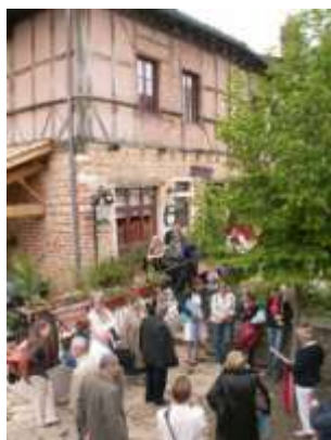
Visite guidée de Châtillon-sur-Chalaronne, par les stagiaires du niveau 2 - formation 2006