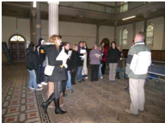
Intervention à l'IREO La Saulsaie- 2007