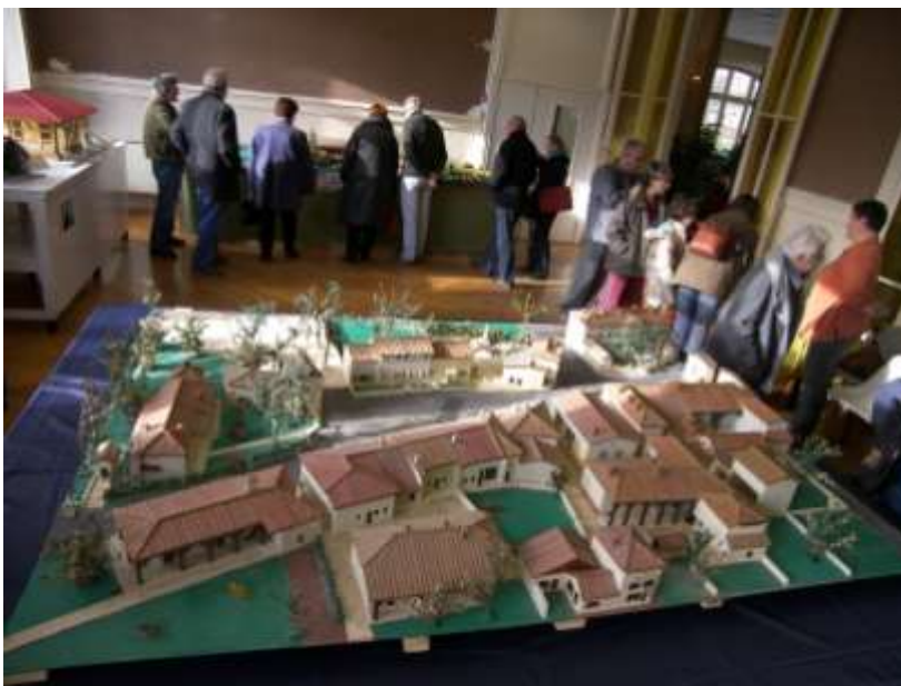
Bourg-en-Bresse, décembre 2006

Si vous possédez ou fabriquez des maquettes ou connaissez des maquettistes professionnels ou amateurs, contactez Patrimoine des Pays de l'Ain.