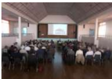
Journée de formation sur le thème des châteaux en octobre 2012

Les repas du midi ne sont pas pris en compte dans le tarif et sont à la charge des participants.