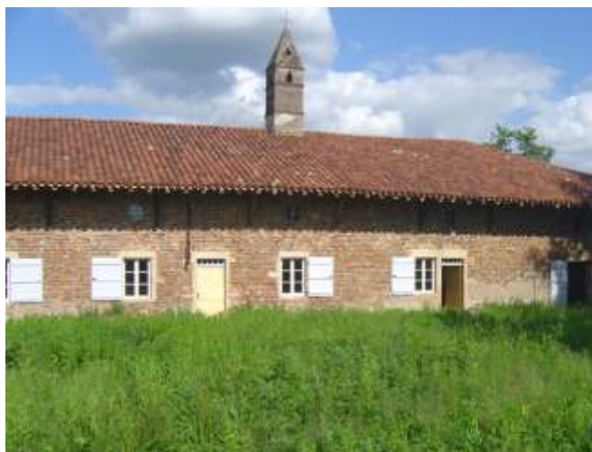
La ferme du Tremblay, Saint-Trivier-de-Courtes, Chantier de restauration de PPA entre 2000 et 2005

Transport et assurance à la charge du preneur (valeur de l'exposition : 1 800 €). Gardiennage obligatoire.