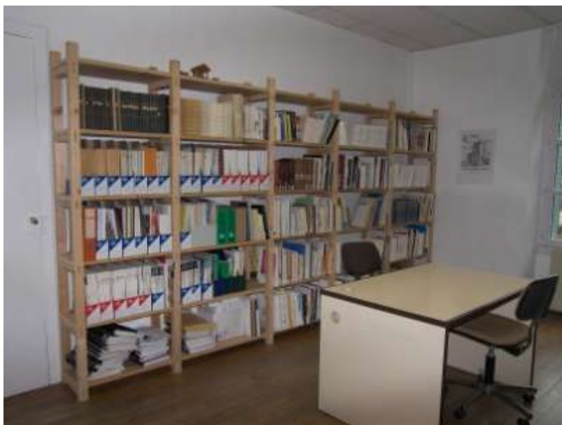
Centre de documentation de Patrimoine des Pays de l'Ain

Patrimoine des Pays de l'Ain offre désormais la possibilité aux membres associatifs, aux chercheurs, étudiants, passionnés... de venir consulter son fonds documentaire sur le patrimoine de l'Ain . Il suffit de prendre rendez-vous par téléphone ou par mail.