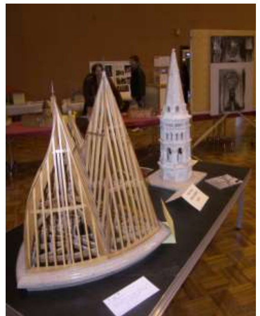
Ambérieu-en-Bugey, décembre 2010