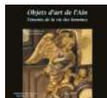
Objets d'art 2010