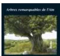
Arbres remarquables 2011