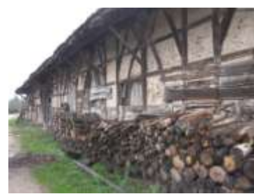
Grosse Grange d'Ozan