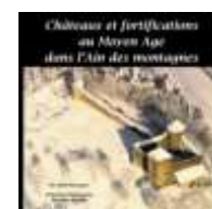
Châteaux médiévaux 2015