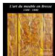
Mobilier bressan 2014