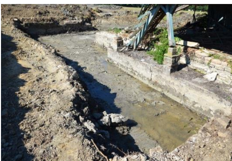
Un bassin en L (juillet 2020)