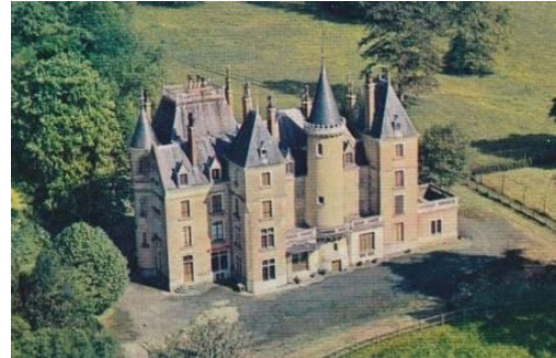
Château de Montépin

Dans sa configuration actuelle, le château de Montépin date de la fin du XIX e siècle. La chapelle qui jouxte le château est de la même époque, ainsi que le lavoir-abreuvoir situé à quelques centaines de mètres.