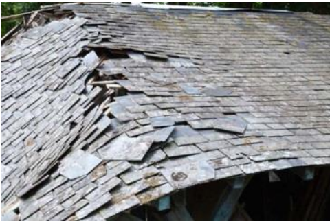
Couverture en ardoises (juillet 2020)

La couverture en ardoises s'apparente à celle du château. La fixation est à crochets. Les ardoises font 30 x 22cm, épaisseur 4mm. Le faitage est couvert de tôles de zinc.