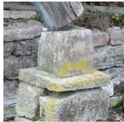
Dé en pierre