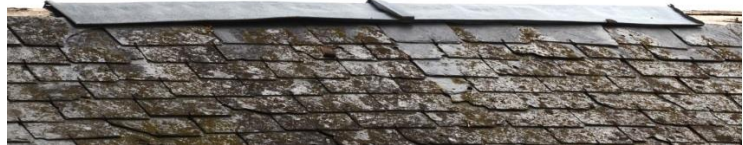
Faitage en zinc (juillet 2020)