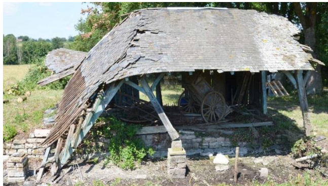
Lavoir-abreuvoir de Montépin (Juillet 2020)

De forme rectangulaire, la partie couverte est constituée d'une charpente en bois (peupliers), composée de 2 travées. Elle repose sur 6 poteaux en chêne. Chacun prend appuie sur un dé en pierre. Le bâtiment était fermé par un bardage bois sur trois côtés et clos par une porte.