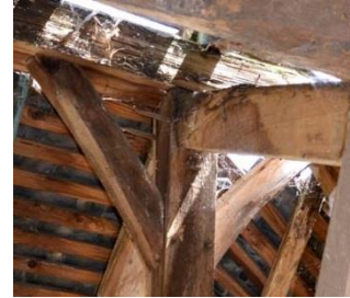
Haut du poinçon