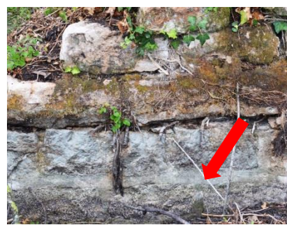
Joints des pierres (juillet 2020)