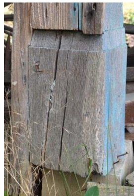
Base de poteau avec adaptation du bardage bois