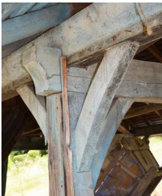
Haut de poteau avec trois aisseliers courbes